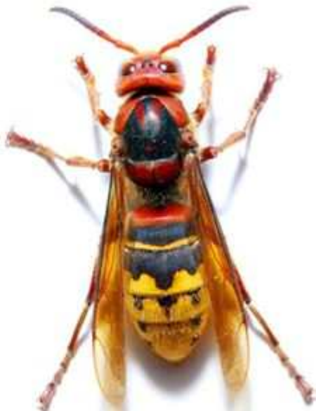
Frelon commun (jusqu'à 4 cm)