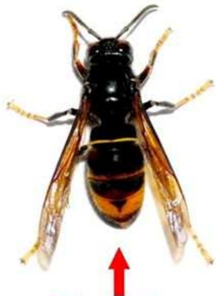
Frelon asiatique (taille réelle 3 cm)